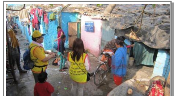
戸別訪問によるワクチン投与活動 2月24日(月) 貧困地帯へ入り、保険師さんと一緒に子供がいる自宅を回ります

現地での活動は、土曜日にNIDsを宣伝する為のパレード(ラリー)を地元の生徒さん達と行き、日曜日にはそれを受けて予防接種所(ブース)に来る子供達へワクチンを投与するのが基本となっています。今年はスラム街が多かった事もあり、この数年で一番多くのワクチン投与を行う事が出来たと思います。