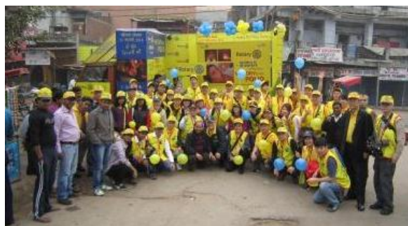
参加したロータリアンボランティア