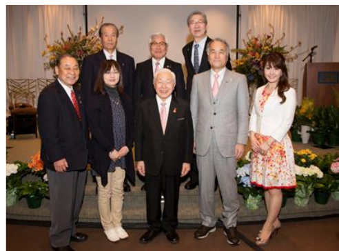
Japan Day (2013年4月19日)

管理委員会サークル: 250,000～499,999.99 米ドル 管理委員長サークル: 500,000～999,999.99 米ドル 財団サークル: 1,000,000 米ドル以上